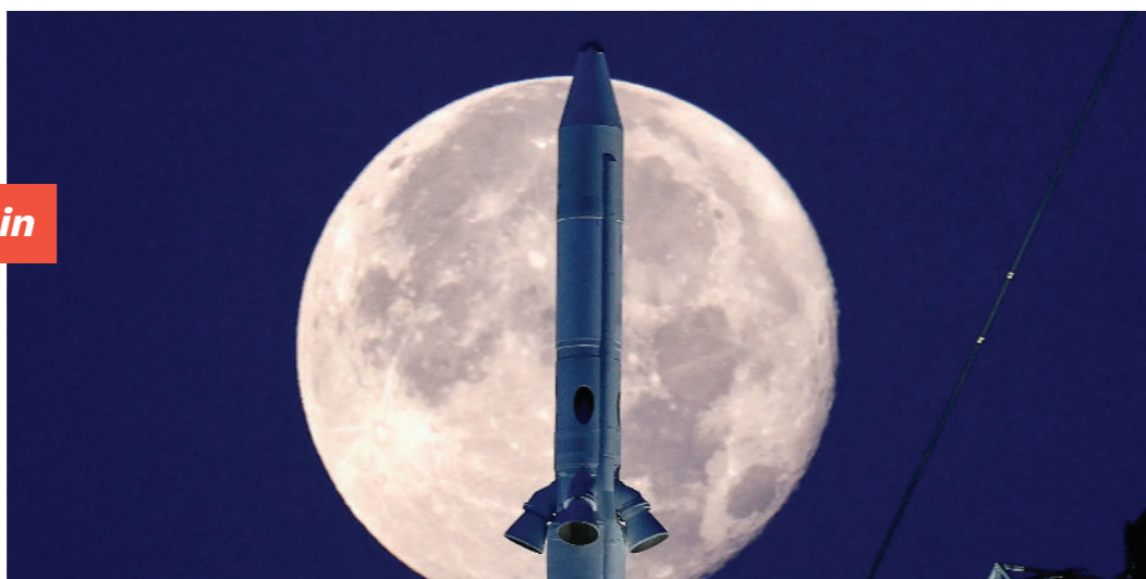
NASAs næste generations måneraket, Space Launch System (SLS) Artemis 1, ved Kennedy Space Center i Cape Canaveral i 2022.